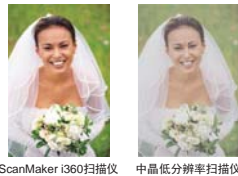
ScanMaker i360扫描仪 中晶低分辨率扫描仪

目前市场主流的4800dpi的分辨率，能使扫描的图像更清晰细致，能将一张普通6寸照片放大至16倍，满足用户对图像的需求，轻轻松松扫出靓丽图像。